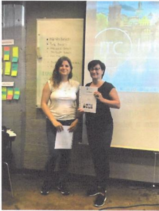
fotó: oklevéllel (a szerző jobbra)