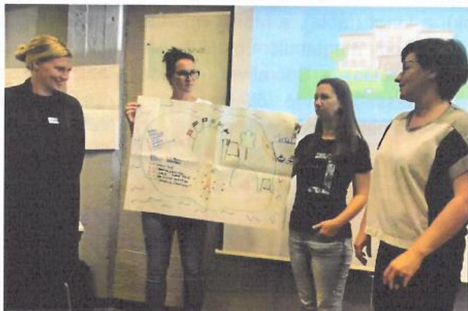
fotó: tréninggyakorlat közben (a szerző jobbra)

Az egymástól tanulás elvét követte a képzés felépítése is, tréning technikákkal, szinte végig élményalapú, gyakorlatorientált tanulással, együttműködve, pont, ahogyan azt a geneZationnál is csináljuk és ahogyan az Antenerben mi, a geneZation trénerai megtanultuk és megszerettük.